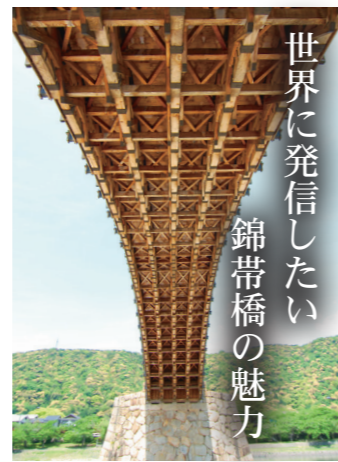
世界に発信したい 錦帯橋の魅力