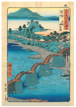
歌川広重 『六十余州名所図会 周防岩国錦帯橋』 所蔵 / 岩国徴古館

5連のリズミカルな造形美。四季折々の自然との調和。錦帯橋を構成する石（重厚感）と木（軽快さ）とのコントラスト。下から見上げたときの構造の複雑さ、桁や梁の一定の規則性の美しさ。観る場所、時季によって無限の美を楽しむことができます。その美しさは、浮世絵師の葛飾北斎や歌川広重などによって描かれています。また、徳川将軍家に嫁いだ篤姫は、わざわざ回り道をして錦帯橋を訪れ、渡る許可が出るのを待ちきれずに橋を渡ったと記録されています。このように錦帯橋には芸術家のみならず、多くの人を魅了する美しさがあります。