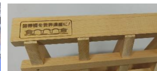
▲ 焼印：「錦帯橋を世界遺産に！」