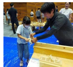
◀ 毎回大好評！ カンナ削り