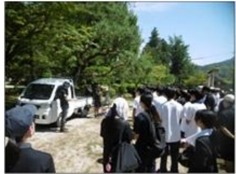
(参考) 昨年度の様子

内容：錦帯橋及びその周辺の清掃を通して歴史的価値の高さを再認識するとともに、文化財の維持に取り組む地域への貢献活動を行う。