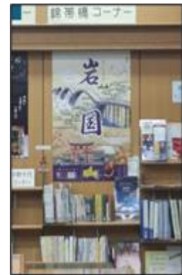
中央図書館の展示

アドレス https://web.d-library.jp/iwakuni/g0101/top/